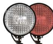
фары на СИМ